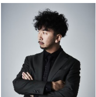
カリスマカンタロー

ラッパー、シンガーソングライター。2020年株式会社BMSGを設立し自らが代表取締役CEOに就任。さらに、ボーイズグループ発掘オーディション『THE FIRST』を開催し、音楽プロデューサーとしても注目を集める。