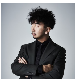
カリスマカンタロー